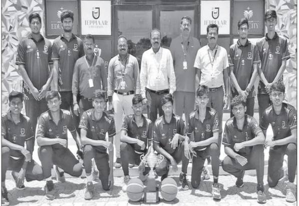
தமிழ்நாடு உடற்கல்வி மற்றும் விளையாட்டு பல்கலைக்கழகம் சார்பில் நடந்த கூடைப் பந்து போட்டியில் சாம்பியன் பட்டம் பெற்ற ஜேப்பியார் அணி வீரர்களை படத்தில் காணலாம். இறுதிப் போட்டியில் 72-36 என்ற புள்ளிக் கணக்கில் அண்ணாமலை பல்கலைக்கழகத்தை தோற்கடித்தது.

‘யு - 19’ கிரிக்கெட் ஜேப்பியார் வெற்றி போட்டியில், ஜேப்பியார் மற்றும் புதுார் அரசு பள்ளி அணிகள் மோதிய போட்டி. இடம்: புதுப்பாக்கம், கிழக்கு கடற்கரை சாலை. சென்னை, ஜூலை 2- ரோட்டரி கிளப் ஆப் சென்னை செரினிட்டி, மெட்ராஸ் இன்டர்நியல் சிட்டி மற்றும் சென்னை மில்லினியம் இணைந்து, பள்ளிகளுக்கு இடை யிலான ‘யு - 19’ கிரிக் கெட் போட்டியை, வார இறுதி நாட்களில் நடத்தி வருகின்றன. ரோட்டரி செரினிட்டி கோப்பைக்கான இப் போட்டிகள், கெருகம் பாக்கம், ராயப்பேட்டை உள்ளிட்ட நான்கு இடங் களில் நடக்கின்றன. லாலாஜி மெமோரி யல், செயின்ட் பீட்ஸ், நெல்லை நாடார், பி.எஸ். பி.பி., அரசு பள்ளி உட் பட 16 அணிகள் வகுப் ‘குருப்’களாக பிரிக்கப் பட்டு உள்ளன. நேற்று முன்தினம் கிழக்கு கடற்கரை சாலை, புதுப்பாக்கத்தில் நடந்த 31 ஓவருக்கான போட் டியில், ஜேப்பியார் மற்ற றும் புதுார் அரசு பள்ளி அணிகள் மோதின. ‘டாஸ்’ வென்று முதல் பேட் செய்த ஜேப்பியார் அணி, 31 ஓவர்களில், ஏழு விகெட் இழப் புக்கு, 184 ரன்களை அடித்தது. அடுத்து பேட் செய்த, அரசு பள்ளி, 31 ஓவர்கள் முழுமையாக வெளியாக யாடி, ஏழு விகெட் இழந்து, 167 ரன்களை அடித்தது. 17 ரன்களை வித்தியாசத்தில், ஜேப்பி யார் பள்ளி அணி வெற்றி பெற்றது.